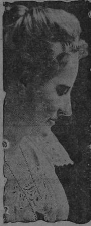
SEÑORA DE ROOSEVELT (CABLES ESPECIALES)

Su esposa é hija en el Hospital Escenas que se desarrollaron allí