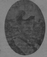
EL REY DE BELGICA

PARIS, OCTUBRE.—Oficialmente anuncia la próxima visita de Fallières á Bélgica, donde se le prepara un suntuoso recibimiento.