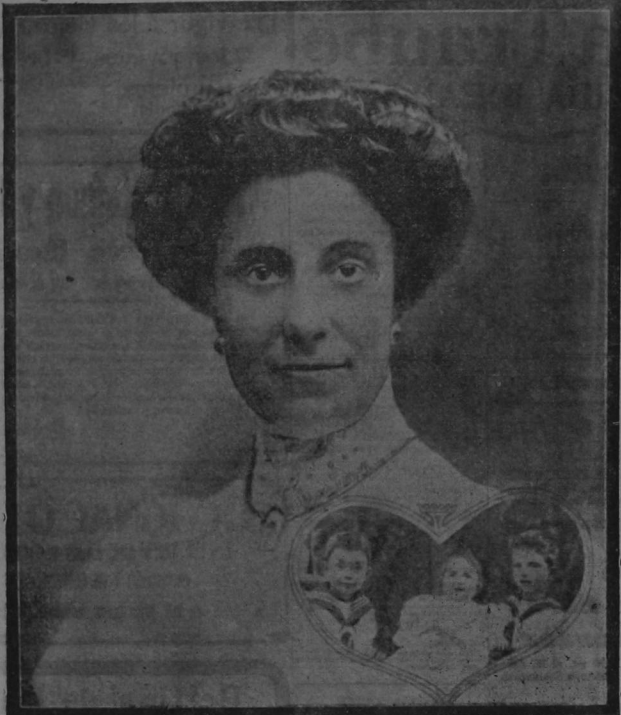
Último retrato de la Infanta, acompañada de sus tres hijos.